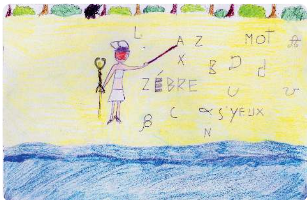
Hermès invente l'alphabet...