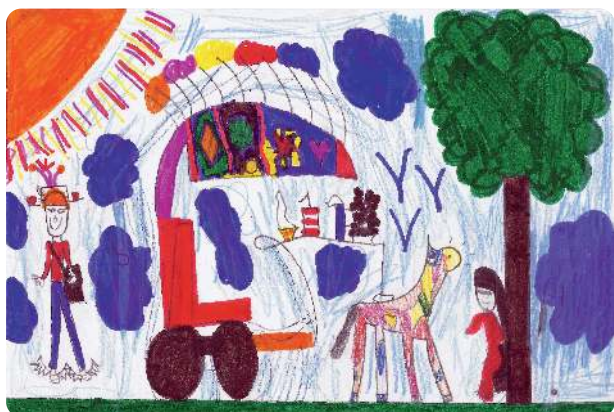
4 Hermès redevient voleur...