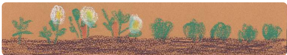
Silence ça pousse...

Ralentissez en passant devant l'école. Vous les verrez.