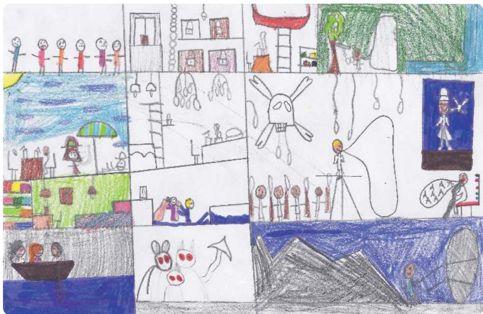
Hermès rend visite à son oncle Hadès, dieu des enfers