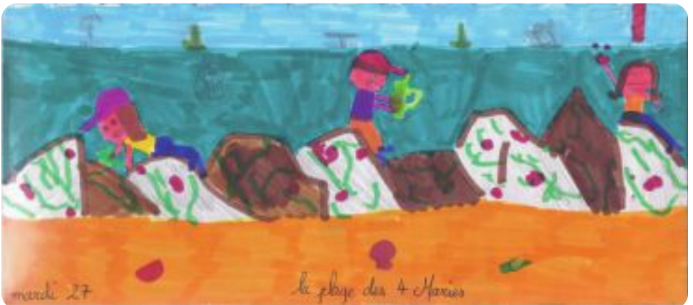
Dessin d'Alice Lantheaume